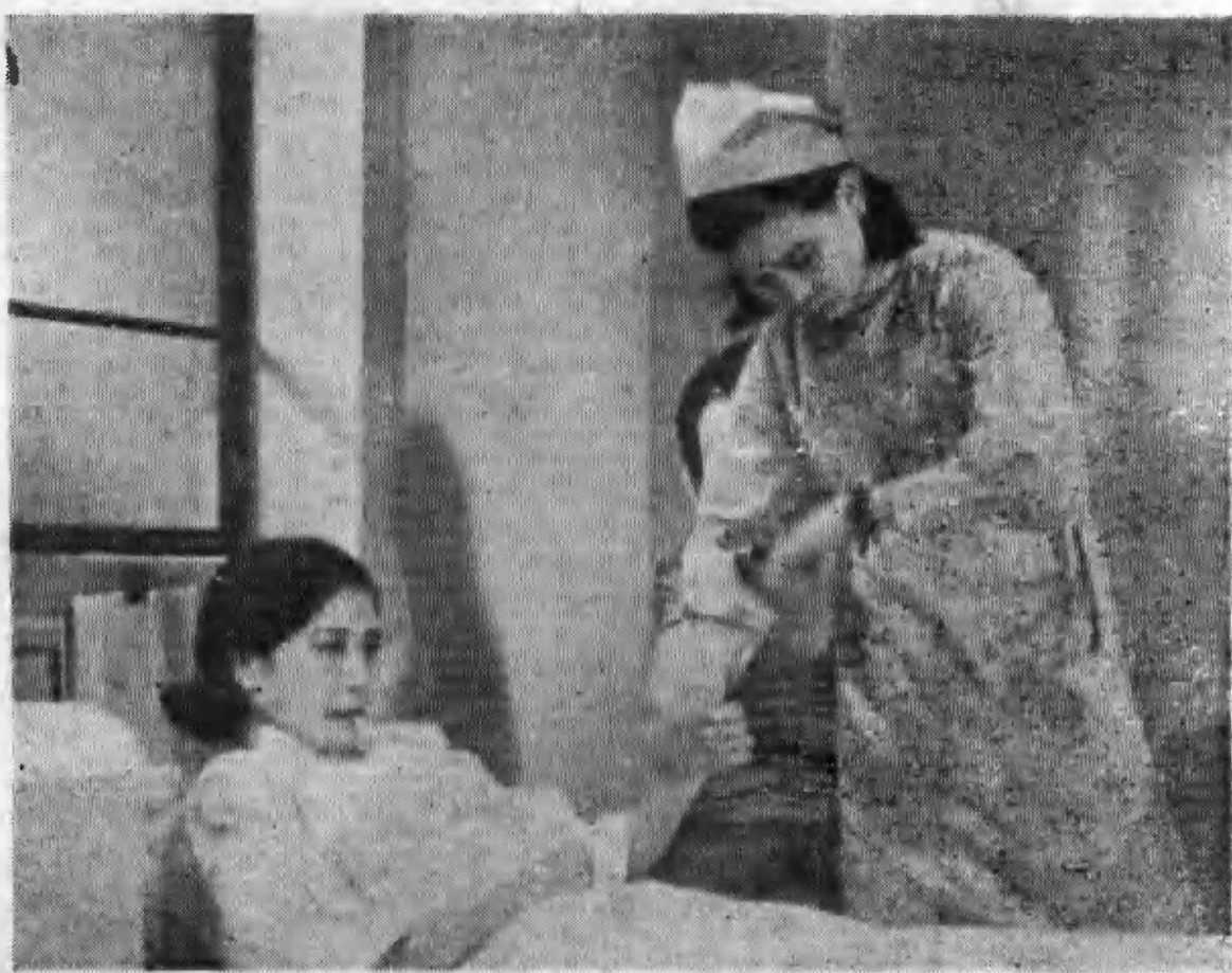
↑ 阮玲玉在「國風」中病時之表演